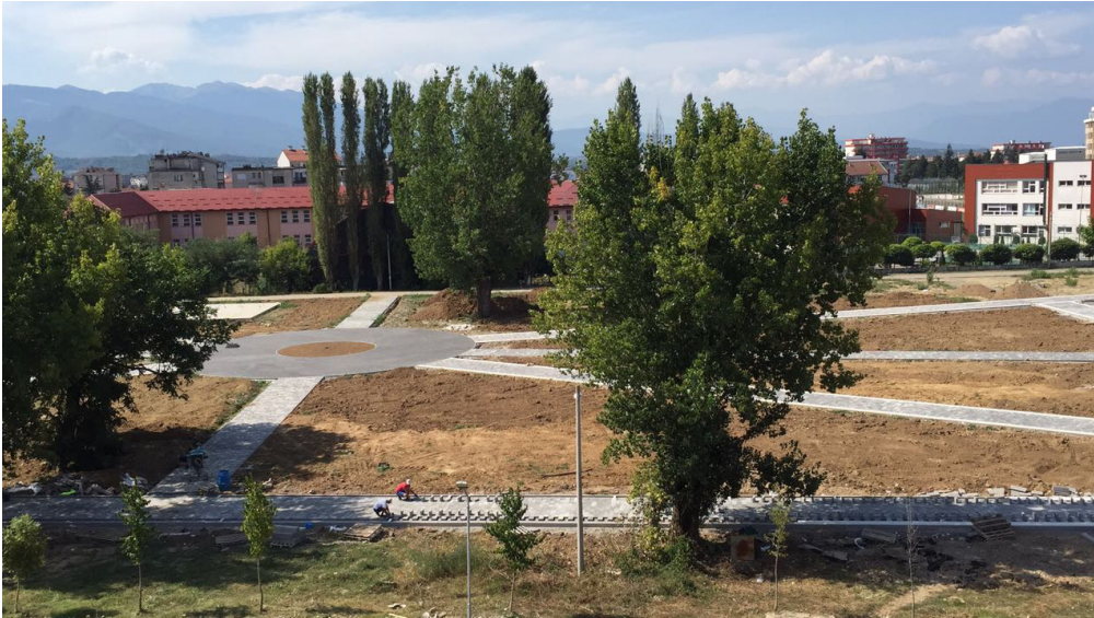
Gjatë ndërtimit të Parkut të Qytetit në Gjakovë