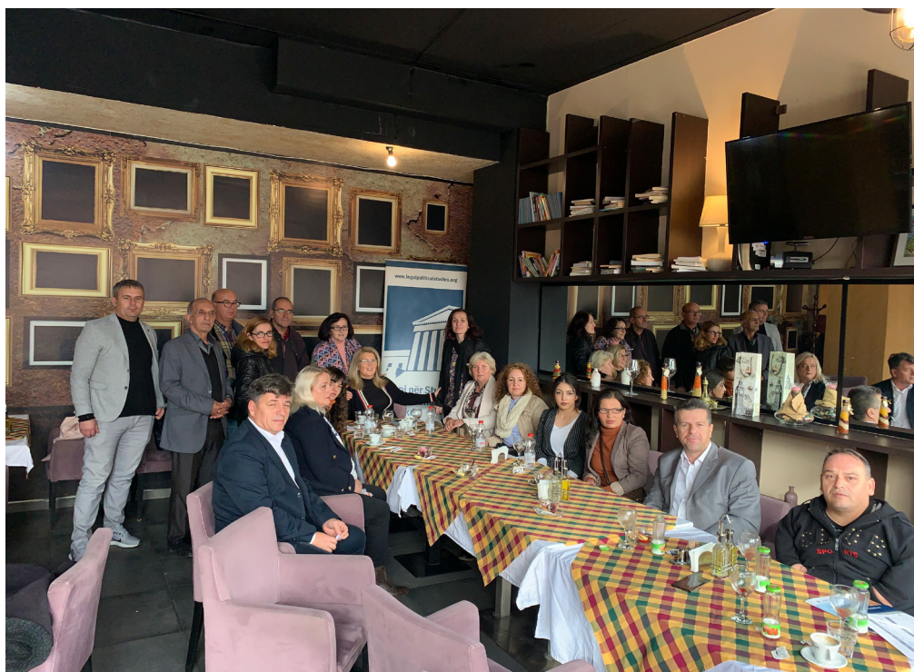
Takim me ekipin e AS për lumin Mirusha në Gjilan

Në korrik 2017, komuna hapi një proces të prokurimit për rivitalizimin e hapësirës rreth pjesës jugore të lumit. Një shumë totale prej 350,000.00 €, dhe projekti ishte parashikuar të përfundonte brenda një periudhe prej 180 ditësh 5 . Si rezultat, në Tetor 2017, "EL-BAU" Sh.p.k. iu dha kontrata me një shumë të përgjithshme prej 294,489.00 €. Qëllimi përfundimtar i këtij projekti ishte të rigjallërojë hapësirën përreth pjesës jugore të lumit, të sigurojë që ujërat e zeza të jenë të izoluar mirë dhe të zgjidhet çështja me erën e padurueshme të fekaleve.