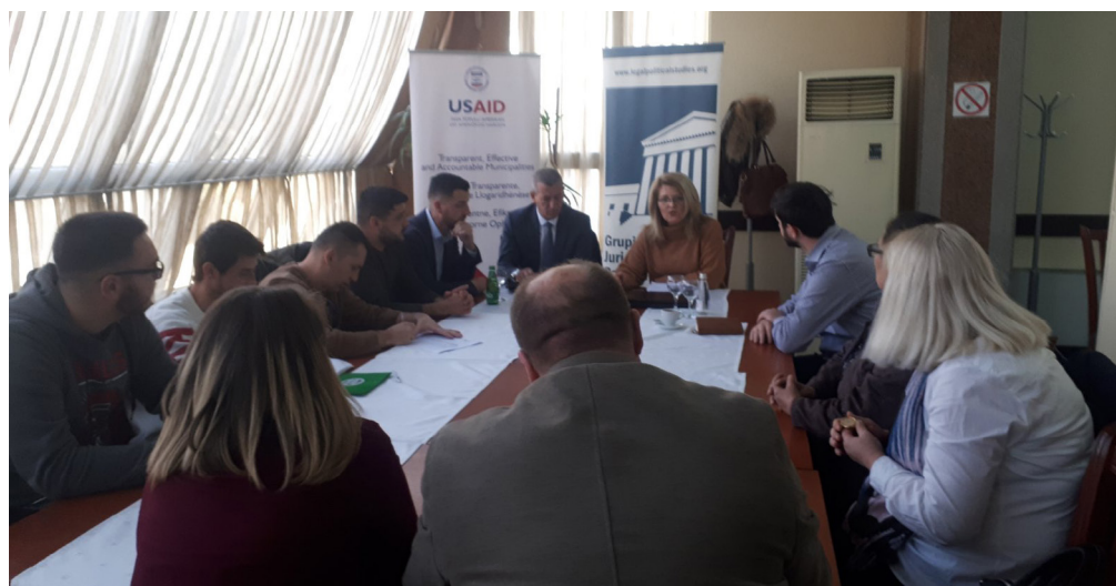
Takim me ekipin e AS në Pogradje

Komuna e Gjilanit hapi një proces të prokurimit për ndërtimin e një Objekti Sportiv për Futboll të Vogël, Volejbol dhe Basketboll 8 në një fshat të vogël të Pogradjes, disa kilometra larg qytetit. Për këtë qëllim, një shumë prej 30,000.00 € ishte ndarë nga fondet e komunës. Në korrik 2018, u nënshkrua një kontratë me kompaninë me emrin "H-Projekt", e cila ra dakord të përfundonte projektin brenda dy muajsh dhe brenda vitit 2019. Nga të gjithë projektet e monitoruara, ky ishte i vetmi që përfundoi brenda afatit. Me një shumë totale prej 22.568,64€, kontraktuesi arriti të dorëzojë në kohë, dhe objektet tashmë ishin duke u përdorur nga banorët.