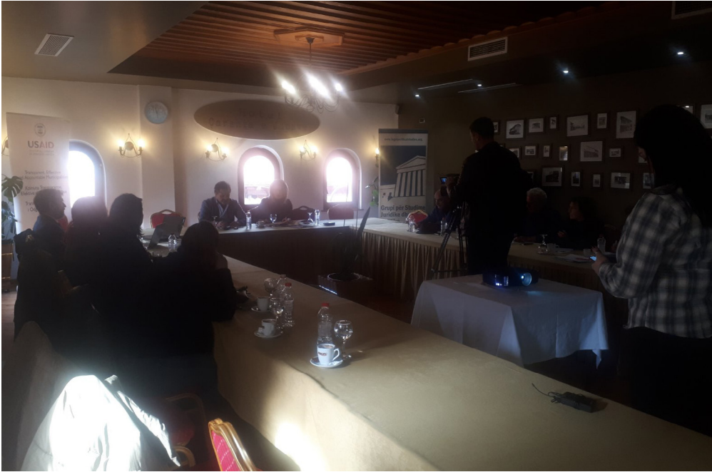
Takimi me ekipet e AS në Gjakovë