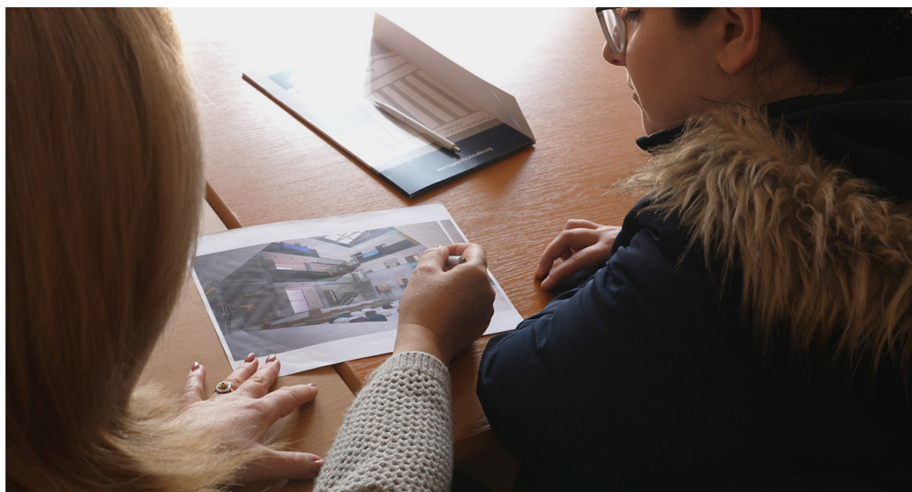
Takimi i Ekipit të AS me zyrtarët komunal në Pejë