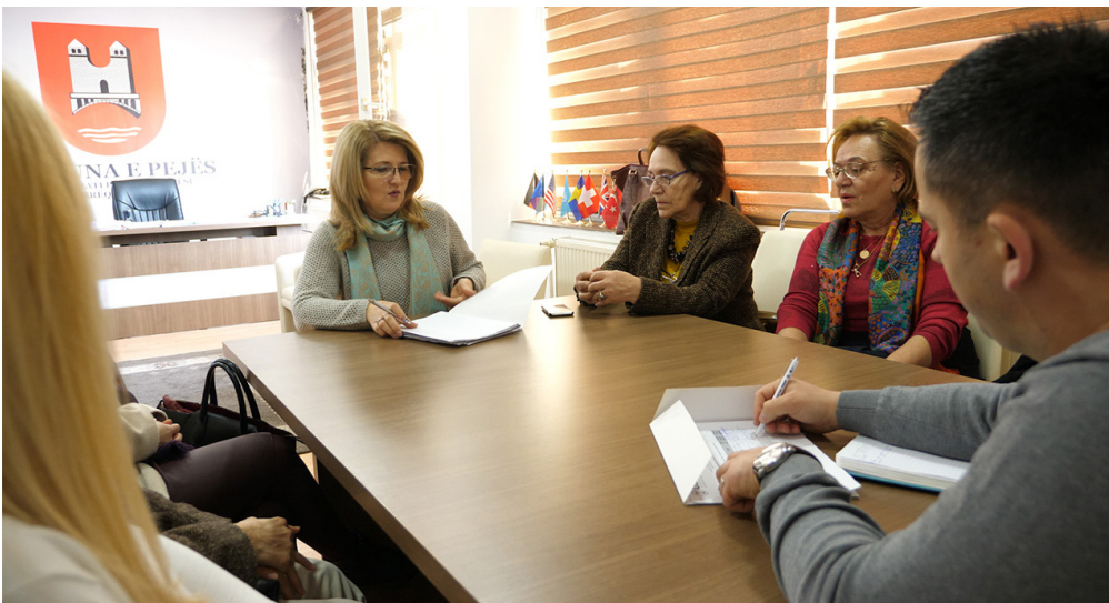
Takimi i ekipit të AS me zyrtarët komunal në Pejë

Gjatë kësaj faze, përveç konsultave të rregullta me ekipet e AS, GLPS organizoi disa vizita në terren së bashku me ekipet për të inspektuar zhvillimin e zbatimit më nga afër, në mënyrë që të zhvillojë tregues realistë për periudhën e monitorimit. Gjatë këtij procesi, ekipet e AS-së u pajisën me të gjitha dokumentet e rëndësishme për proceset e prokurimit të të gjashtë projekteve, në mënyrë që të kishin një pamje më të qartë kur zhvillonin treguesit bazë. Duhet të theksohet se treguesit e performancës duhet të shërbejnë si bazat e periudhës së monitorimit, megjithatë, ata mund të ndryshojnë në varësi të dinamikës së ekzekutimit të punës. Treguesit për shtëpinë e qëndrimit ditor të të moshuarve në Pejë janë si më poshtë: